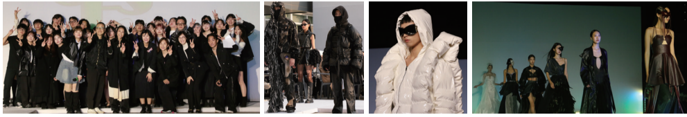
제42회 졸업작품전 유튜브 QR코드